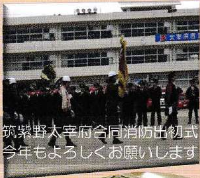
筑紫野太宰府合同消防出初式 今年もよろしくお祈りします