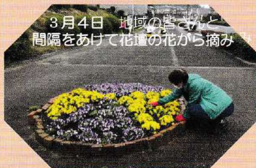
3月4日 地域の皆さんと 間隔をあけて花壇の花から摘み