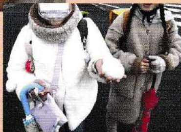
2月18日 この冬 初めて最後の雪が降 り、わずかに積もっ た雪を集めて嬉しそ うに小学生が登校し ました