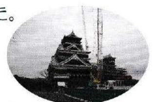
復興の進む熊本城

議員は市長と同じように、災害時も姿勢が問われるなど、真に迫る内容でした。筑紫野市においても、市や市議会の防災対策を一段と進めることが重要だと考えながら帰路につきました。