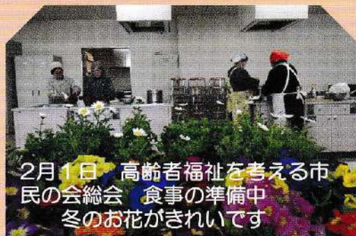
2月1日 高齢者福祉を考える市 民の会総会 食事の準備中 冬のお花がきれいです