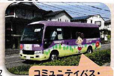
コミュニティバス・カーリアバスへの取り組みは続けます!

市長 現在のカミーリヤバスのルートは相当な部分が既存の路線バスと重複しており、直ちに位置づけを変更することは困難である。