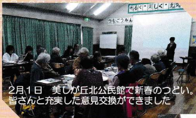
2月1日 美しが丘北公民館で新春のつどい。 皆さんと充実した意見交換ができました