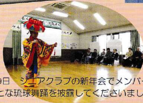
1月19日 シニアクラブの新年会でメンバーが みごとな琉球舞踊を披露してくださいました