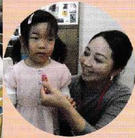
1月11日 高齢者サ ロンは子どもたち も楽しめる内容で した。ポラン ティアが用意し てくださった食事 もみんなでおいしくい たできました。